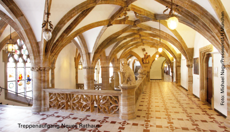
Treppenaufgang Neues Rathaus