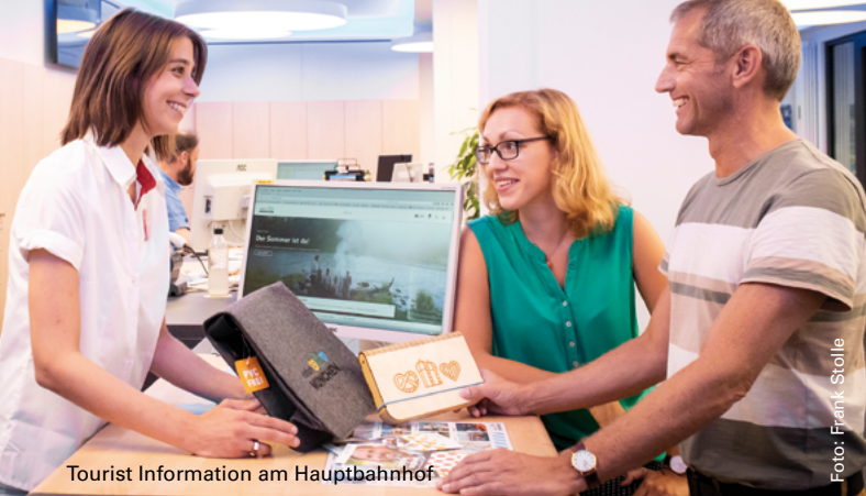
Tourist Information am Hauptbahnhof