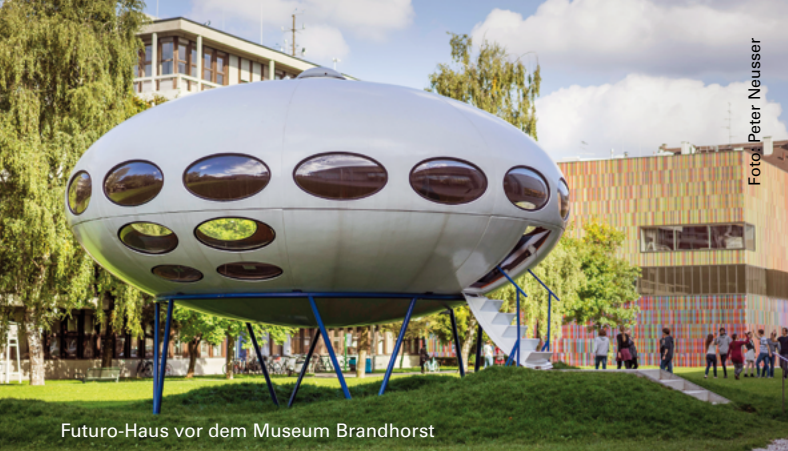
Futuro-Haus vor dem Museum Brandhorst