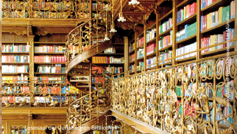
Lesesaal der Juristischen Bibliothek