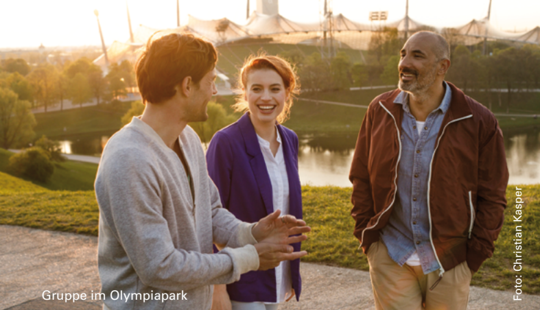
Gruppe im Olympiapark