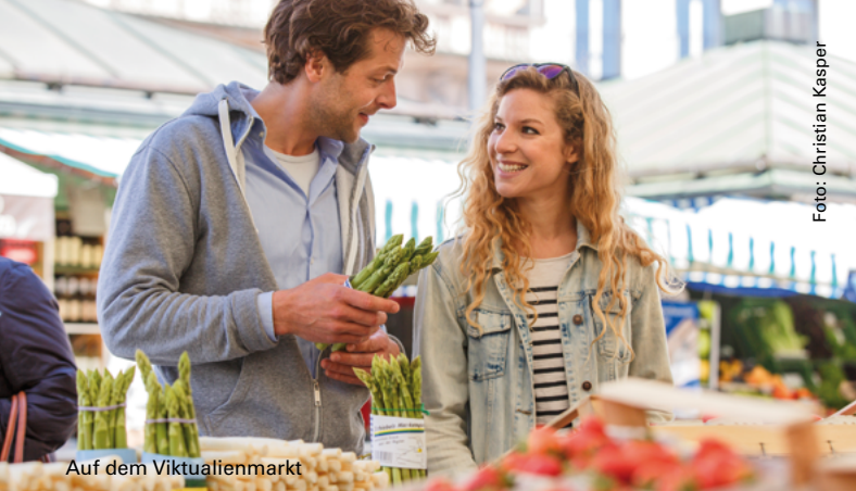
Auf dem Viktualienmarkt