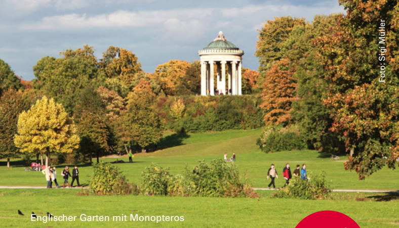
Englischer Garten mit Monopteros