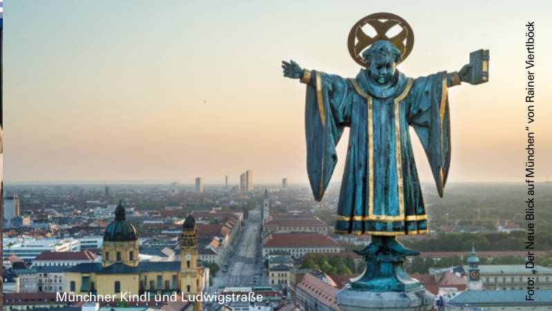
Münchner Kindl und Ludwigstraße