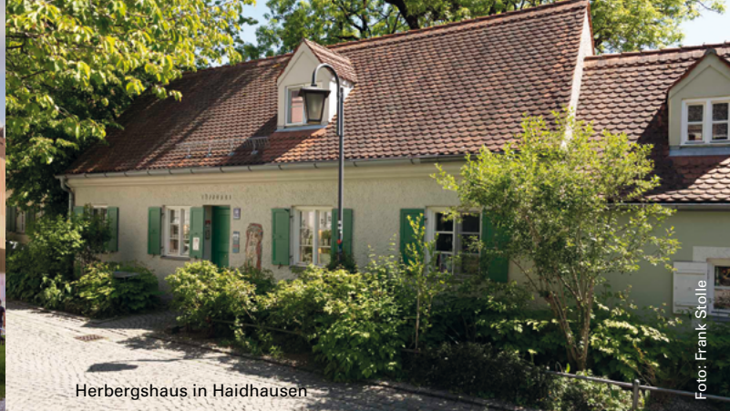
Herbergshaus in Haidhausen