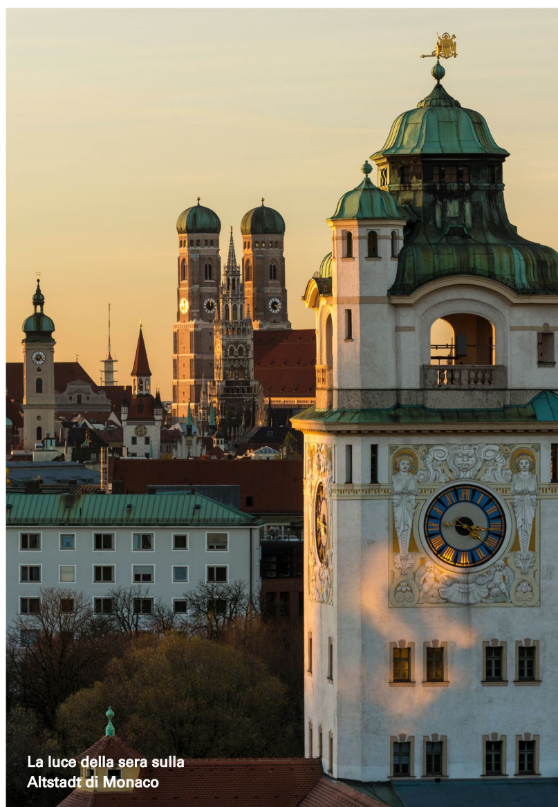
La luce della sera sulla Altstadt di Monaco