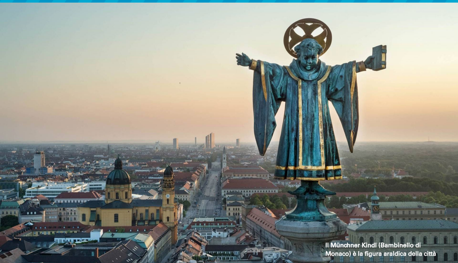
Il Münchner Kindl (Bambinello di Monaco) è la figura araldica della città