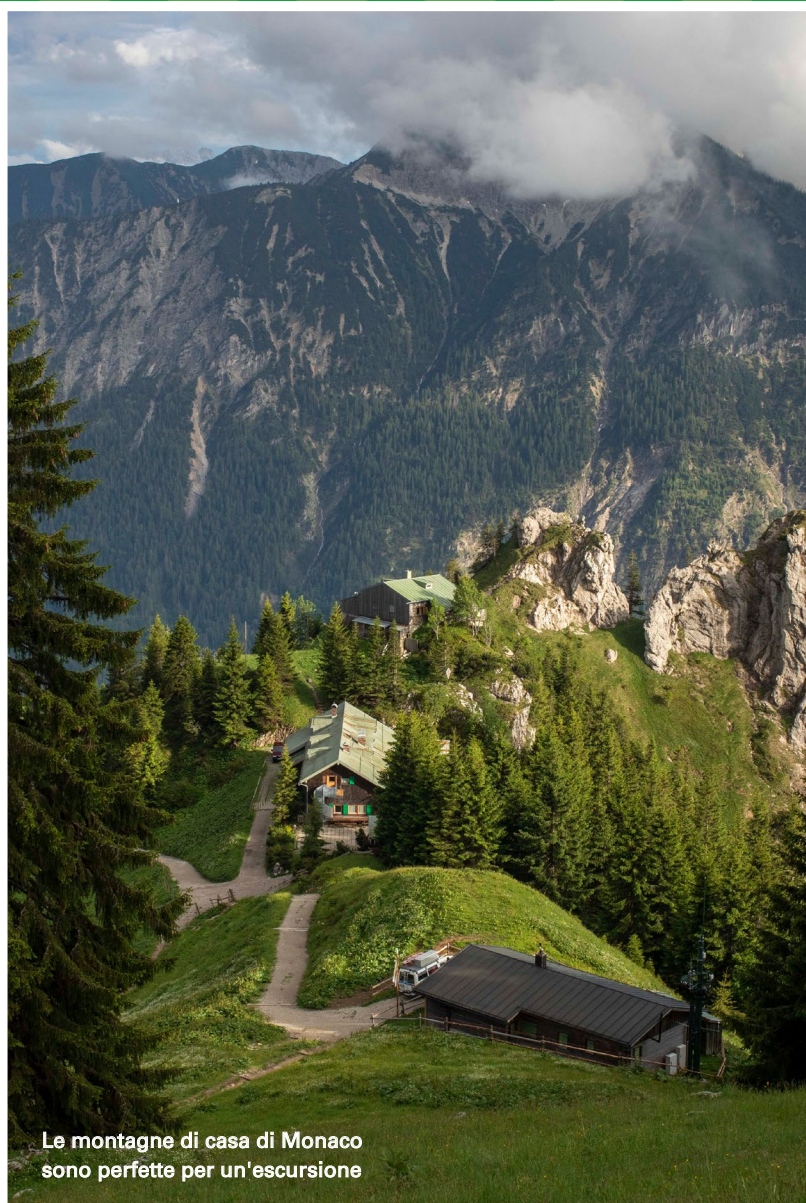
Le montagne di casa di Monaco sono perfette per un'escursione